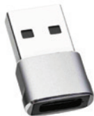
USB-A zu USB-C Adapter für herkömmliche USB-Anschlüsse.

Der VAC Pro wird mit einer Vielzahl von Aufsätzen und Zubehör geliefert, welche für unterschiedliche Einsatzzwecke entwickelt wurden.