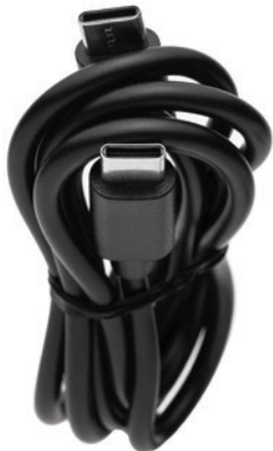
USB-C Kabel Standard 1 m Kabel zum Aufladen und Betreiben Ihres VAC Pro.