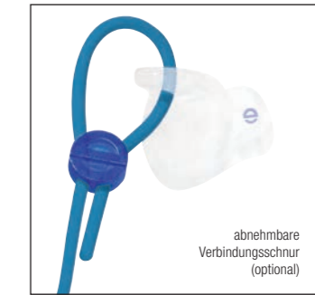
abnehmbare Verbindungsschnur (optional)