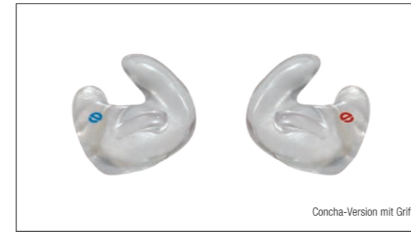
Concha-Version mit Griff